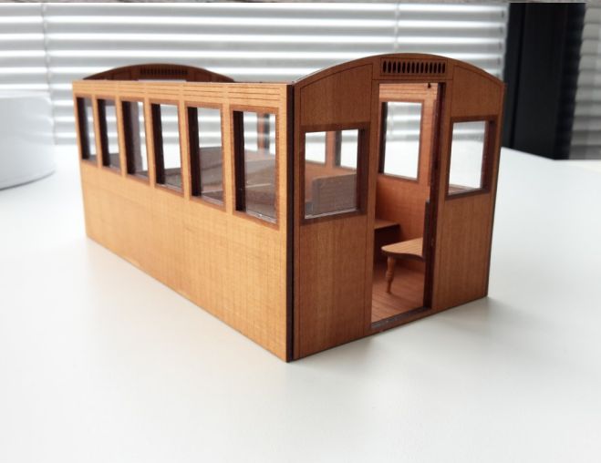
North motorwagen - prototype