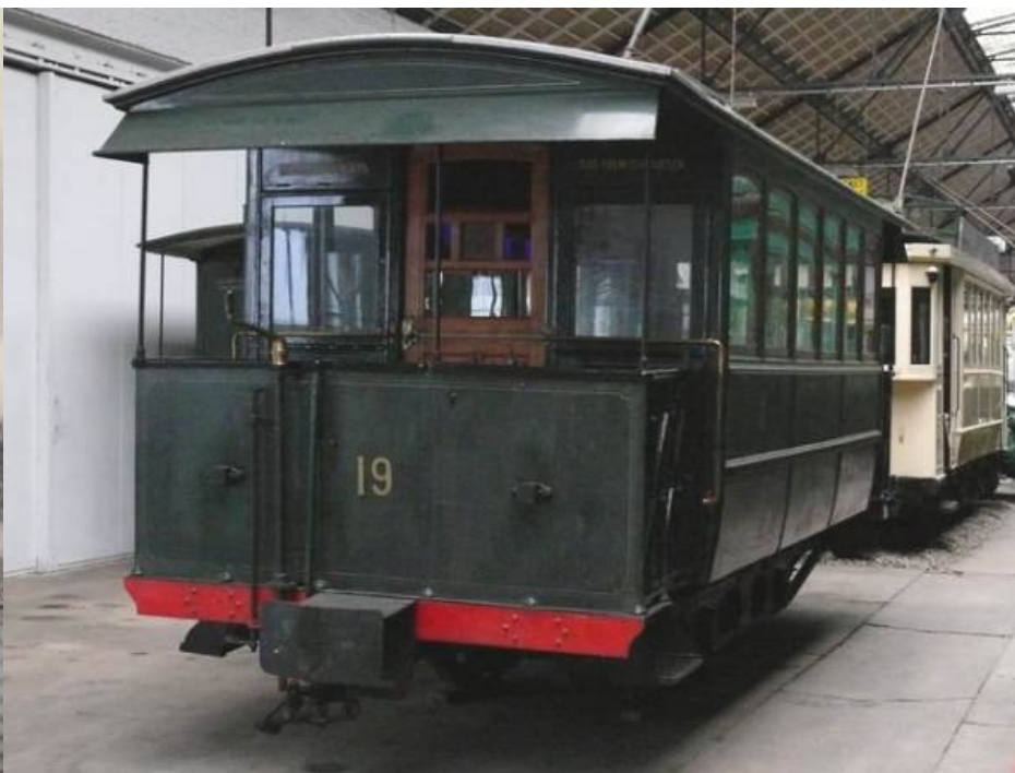
NMVB motorwagen 9169 (Westende ong. 1905)