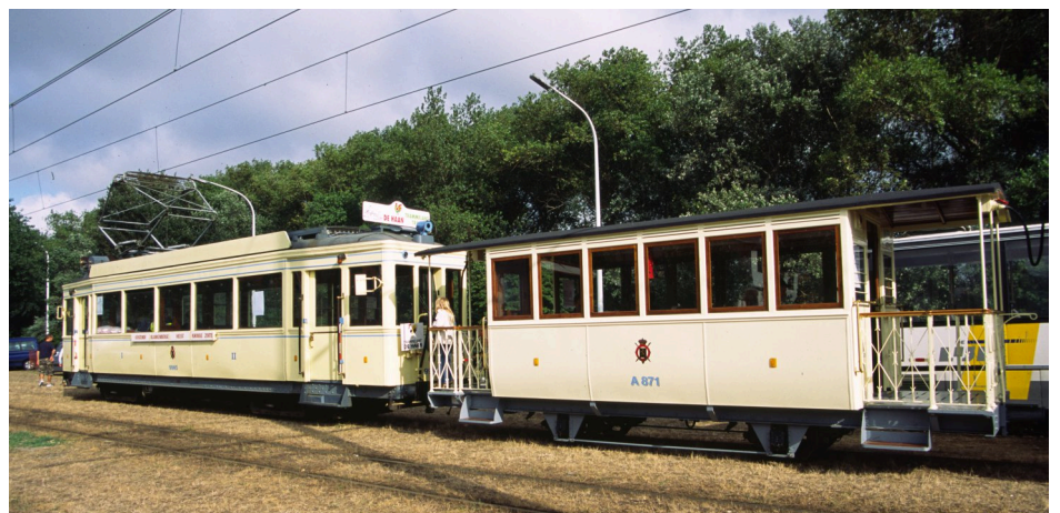
Traile A.871 - Le Coq / De Haan (Trammelant)